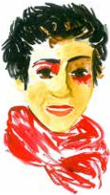
Autoportrait d'Alice Zeniter.